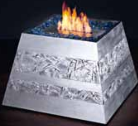
Decoro argento con intarsio Silver inlaid decoration

Finiture disponibili Finishing available